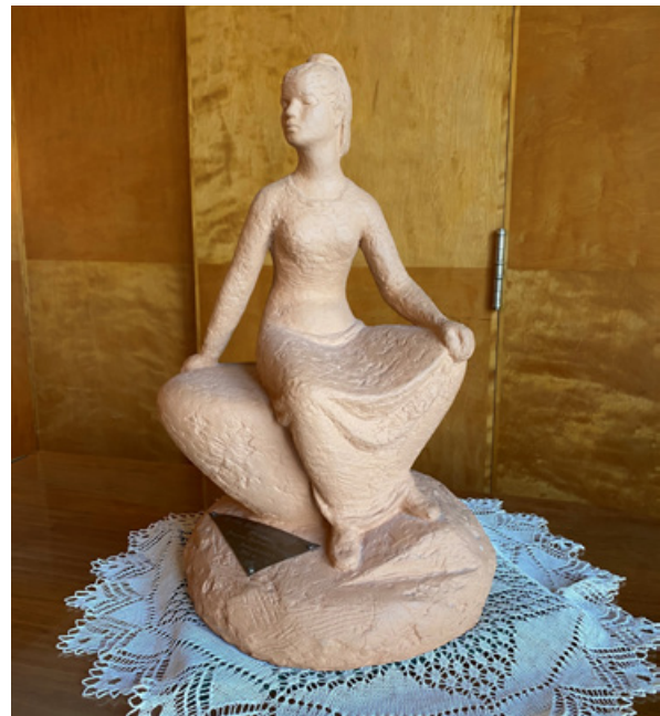
Kunst i Søsterhjemmet.

Hvert år drar ledergruppen ved Haraldsplass Diakonale Stiftelse på en reise hvor vi spesielt fokuserer på de verdier som Stiftelsen er etablert på og det som er vårt formål. Vi er nå flere nye i ledergruppen, og flere kjente lite til våre to «søsterorganisasjoner» i Norge: Diakonhjemmet og selvfølgelig Diakonissehuset Lovisenberg. I februar, før korona var et veldig kjent begrep, valgte vi å dra til Oslo for å bli bedre kjent med våre «søstre». Og det ble både en tankevekkende og inspirerende reise. Diakonhjemmet har vi de senere årene hatt en del