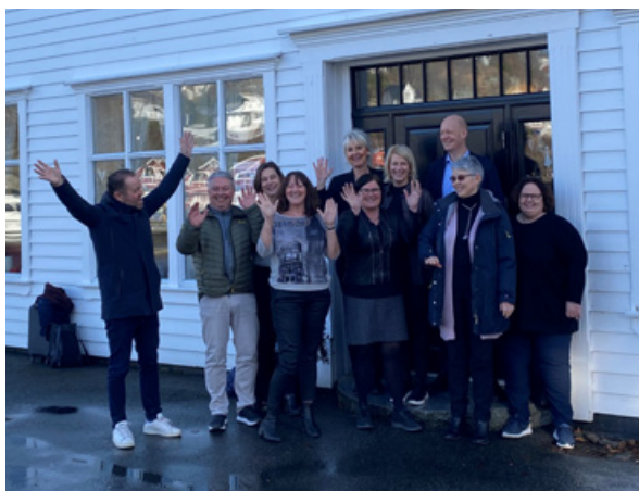
Konsernledergruppen samlet til seminar!

Når vi kan være i en slik utvikling som Stiftelsen er i nå, så er det fordi mange har gått foran med stort mot og med vilje til å utfordre og satse. Vi kan ikke annet enn å beundre og kjenne på ansvaret for det viktige arbeidet som diakonissene har lagt ned i og for denne institusjonen gjennom mange år. Diakonissene gav både lønn og fritid inn for å være noe for andre, og for at Haralds-