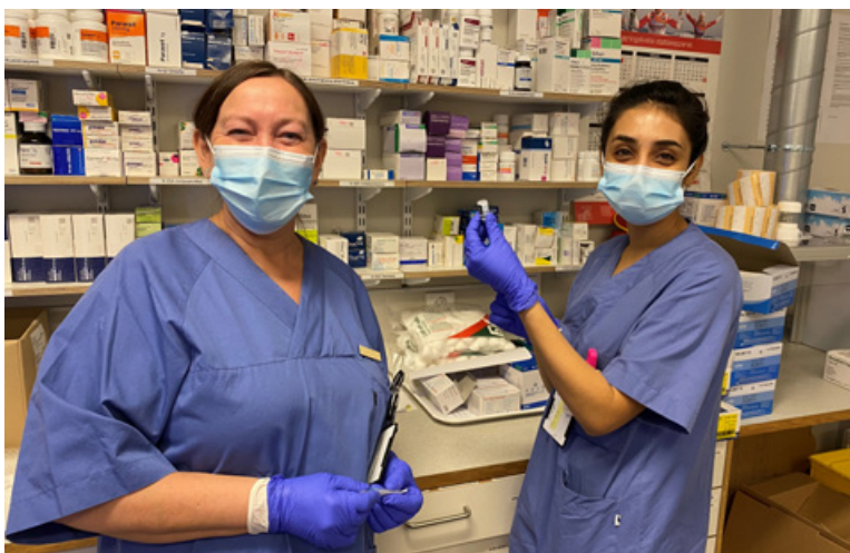
Forberedelse til vaksinasjon av beboerne ved Siljuslåtten sykehjem!