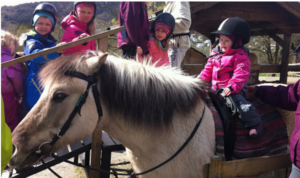
Hesteridning er populært på Soltun Gård!

Diakoni handler om nestekjærlighet og er forankret i det kristne synet på mennesket, i Jesu ord og lære. Diakoni handler også om relasjoner der man gir og får begge veier. Haraldsplass Diakonale Stiftelse har flere diakonale tilbud og aktiviteter.