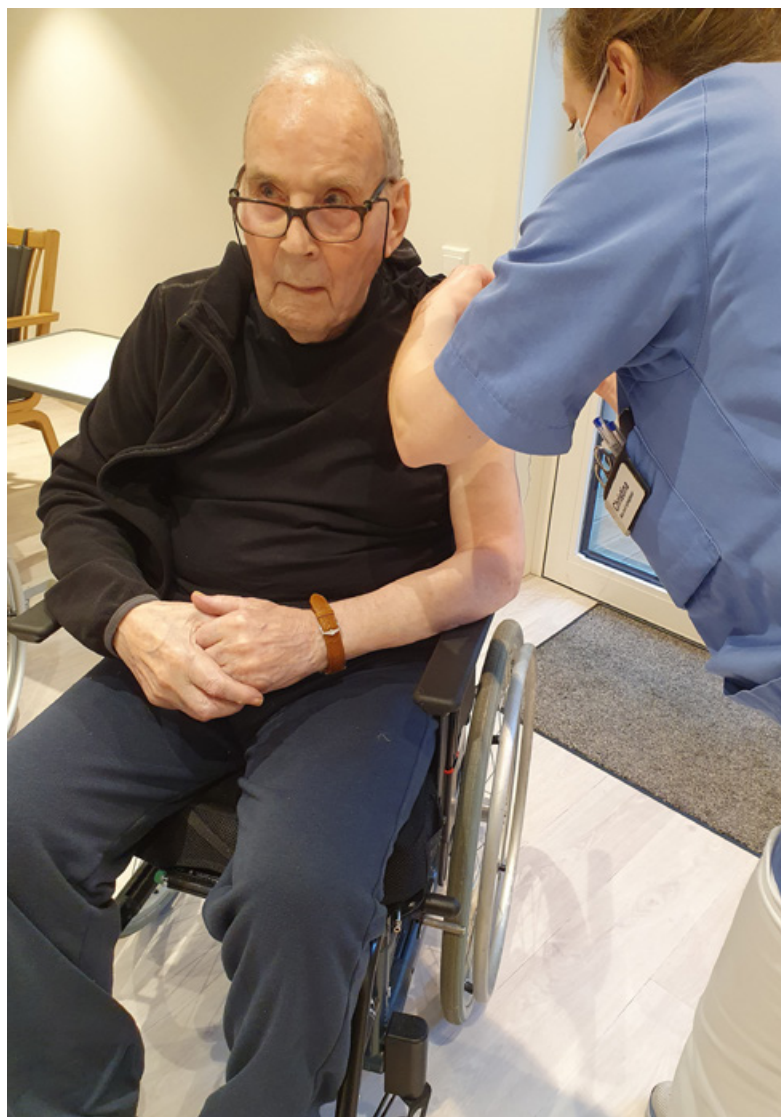
Beboer ved Domkirkehjemmet får koronavaksine.

Domkirkehjemmet ser det som en viktig oppgave å ta imot studenter og elever, da vi kan være en god læringsarena innenfor eldreomsorgen.