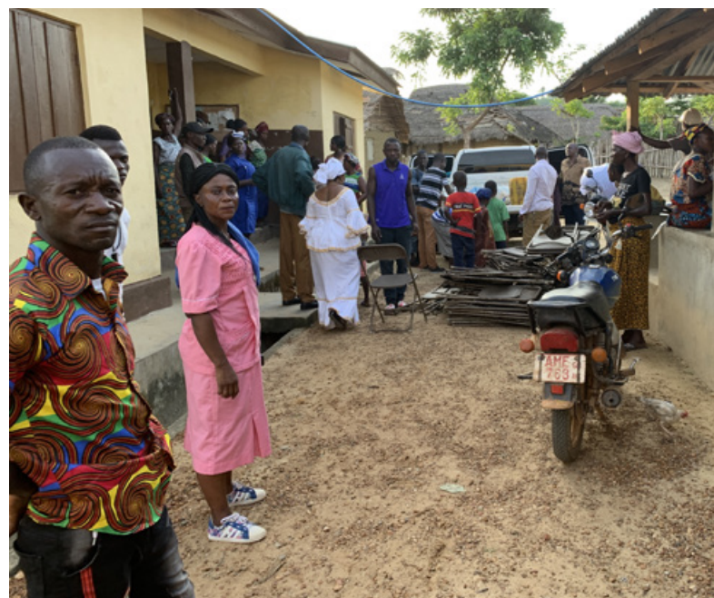
Helsesenteret i Nomo Faama gir et viktig tilbud til befolkningen i regionen.

Haraldsplass Diakonale Stiftelse er også engasjert i annet internasjonalt arbeid, både i EuroDiakonia som har fokus på den nød som er i Europa, i Kaiserswerth Generalconferance som er vår moderorganisasjon og som driver arbeid i mange land over hele verden og Diakonia World Federation som er en verdensomspennende diakonal organisasjon.