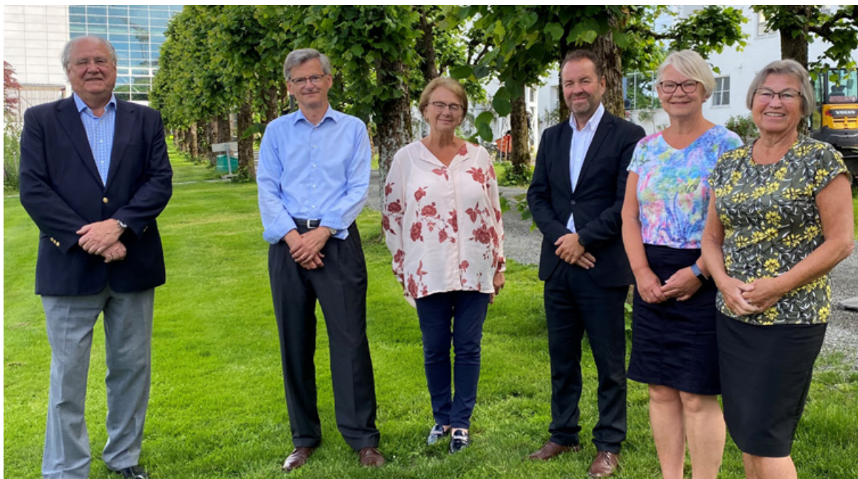
Hovedstyret for Haraldsplass Diakonale Stiftelse.

Det skjer mye positivt arbeid i Haraldsplass Diakonale Stiftelse på tross av et annerledes og krevende år. Arbeidet i 2020 har vært knyttet til både utvikling og vekst i Stiftelsen, og en stor del av utviklingen er knyttet til eiendomsutvikling og rehabiliteringsprosjekter. Det er viktig å fremheve at alt arbeid som blir gjort i Stiftelsen er tuftet på vårt formål, å være relevant for samfunnet rundt oss og med våre tjenester basert på Stiftelsens kristne verdigrunnlag. Våre tjenester skal ha høy kvalitet og kompetanse med hjertevarme.