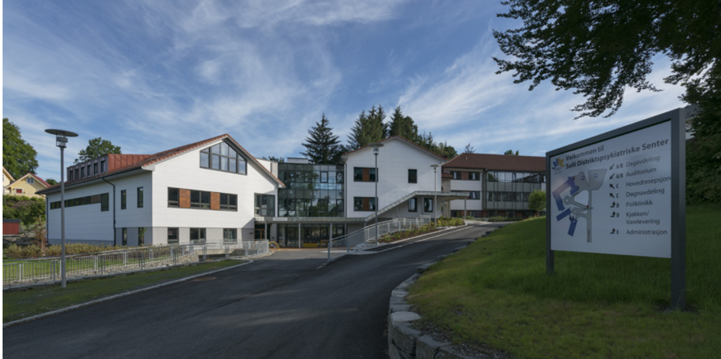
Solli DPS er lokalisert på Nesttun.

3. Vi har styrket pasientsikkerheten blant annet gjennom etablering av elektroniske verktøy for de to største polikliniske enhetene våre, samt videreutviklet og forbedret rutinene for registrering og fordeling av henvisninger med den hensikt å redusere uønsket variasjon og styrket systematikk med gode resultater.