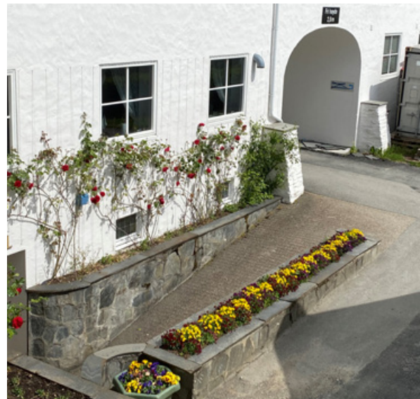
Portalen inn til Søsterhjemmet.

kontakt med, ikke minst knyttet til felles eierskap i VID vitenskapelige høgskole, og Lovisenberg er vårt naturlige kontaktpunkt av historiske årsaker.