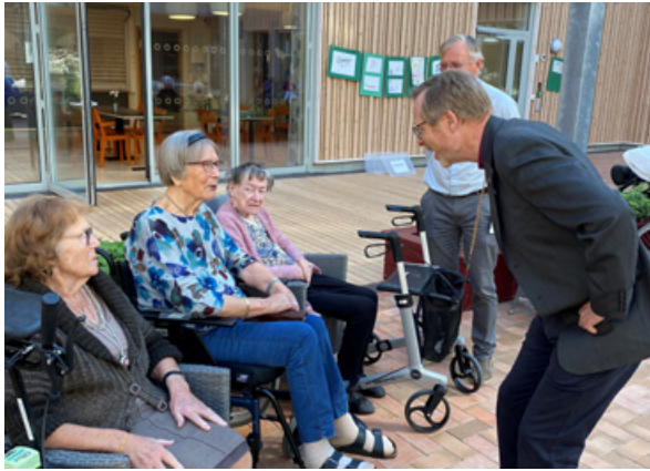
Bispevisitas på Siljuslåtten sykehjem.

Det ble også i år laget en flott juleutstilling i atriehagen i regi av de frivillige.