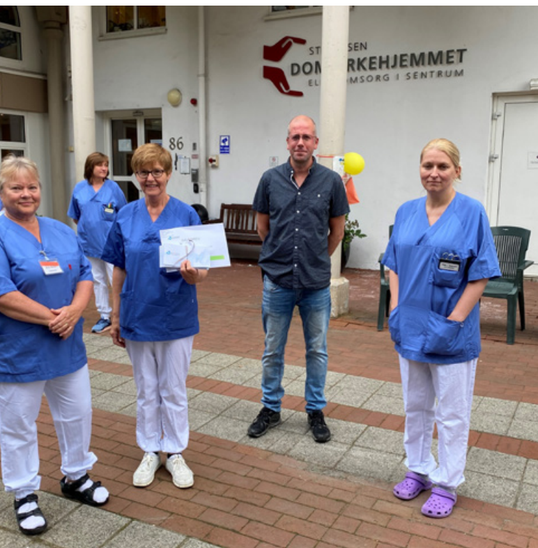
Ansatte ved Domkirkehjemmet tar imot gave fra Haraldsplass Diakonale Stiftelse.

Domkirkehjemmet har hatt tre smitteutbrudd. Med gode rutiner og god innsats fra ansatte har vi klart å begrense utbruddene og hindret massesmitte. Personalet har gjort en utrolig innsats, alt fra renholdsavdeling til ansatte på alle avdelinger.