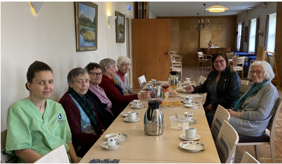
Vaffelkos i Søsterhjemmet etter Middagsbønn. Den gode praten og det sosiale fellesskapet er viktig.