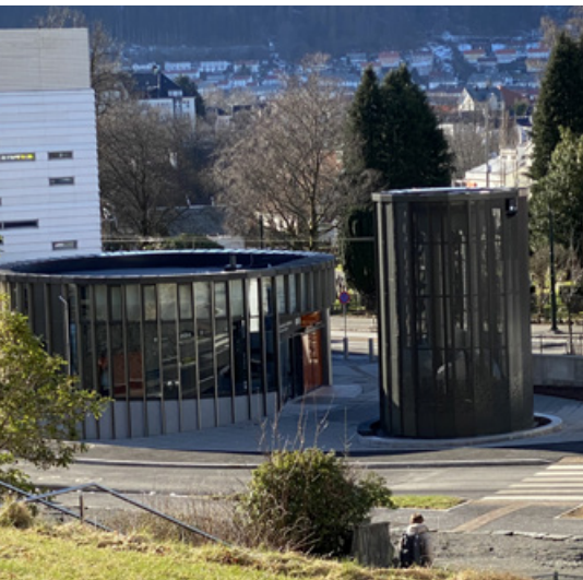
Bybanens holdeplass Haukeland Sjukehus ligger rett utenfor Haraldsplass Diagonale Sykehus. Holdeplassen har to utganger, en i sør til Haukeland universitetssjukehus og en i nord til Haraldsplass.

eller utvikling av bygg og arealer. Det skal etter hvert arbeides mot en ny reguleringsplan for Haraldsplass-området, der også uteareal skal være med.