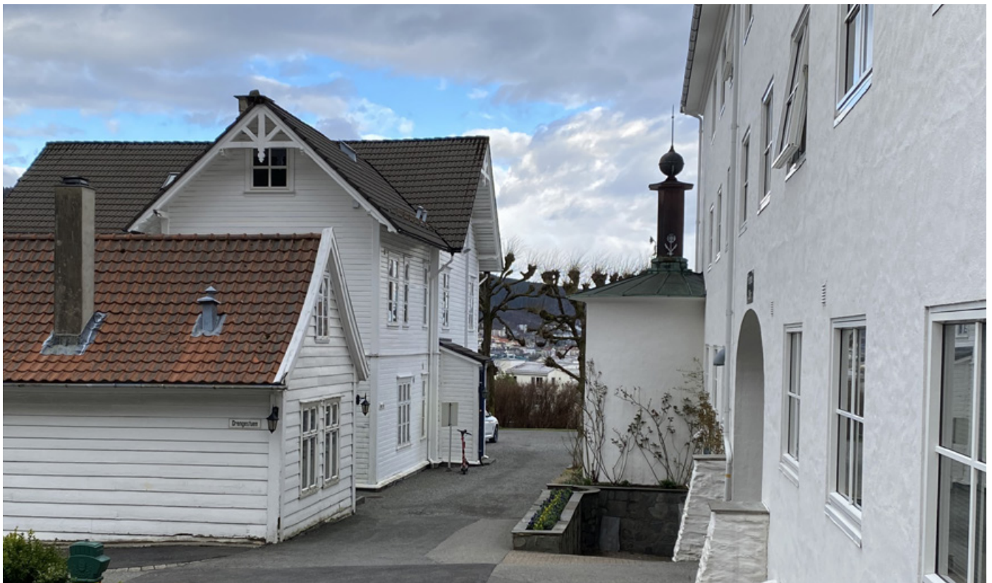
Koselig passasje med historisk sus mellom Drengestuen og Mohns Villa til venstre, og Søsterhjemmet.