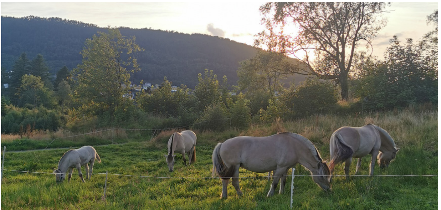
På Soltun Besøksgard kan du blant anna bli kjent med den trufaste slitaren; hesten!

Takk for alt de delte med lesarane. Me ynskjer dykk begge alt godt å lukke til med arbeidet, visjonen og alle møtepunkta de arrangerer på Soltun Besøksgard!