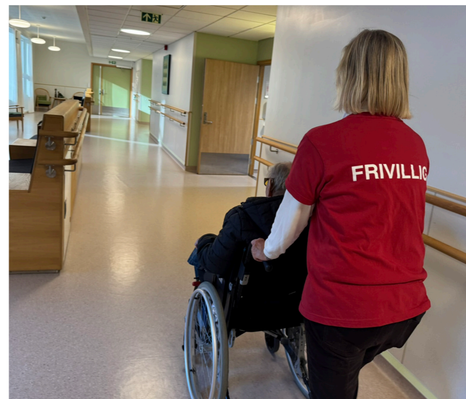
De frivillige gjør en uvurderlig innsats.

I 2025 la engasjerte mennesker ned tusenvis av timer ved sykehjemmene og Hospice Sangen – et arbeid som gir både livskvalitet og livsglede for beboere og pasienter, og mening for dem som bidrar.