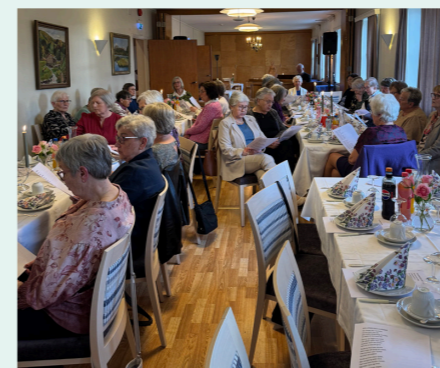
Lørdag kveld var det fellesskapsfest med både faglig og kulturelt innhold.