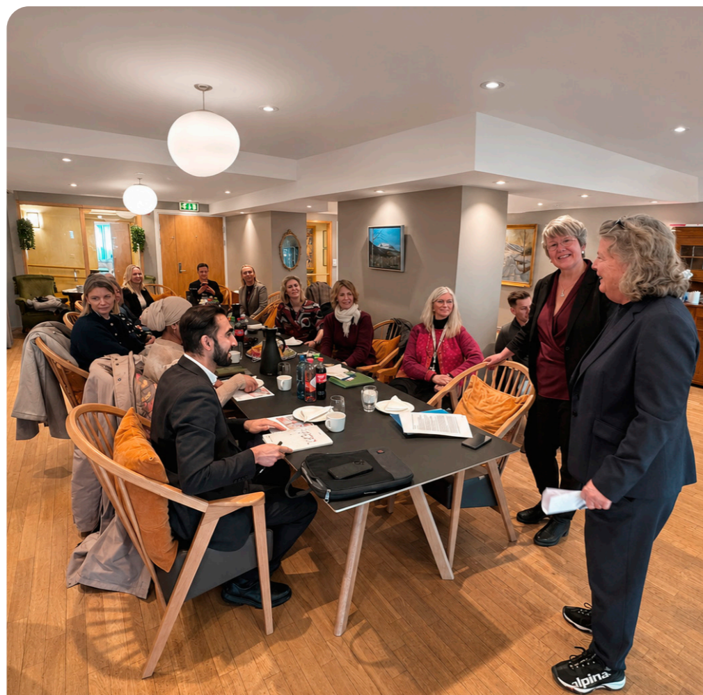
Resultatene fra Grefsenhjemmet er så gode at ICDP nå blir en del av en ny studie ved Fagskolen.

Programmet bygger på åtte samspilltemaer som skal styrke relasjonen mellom