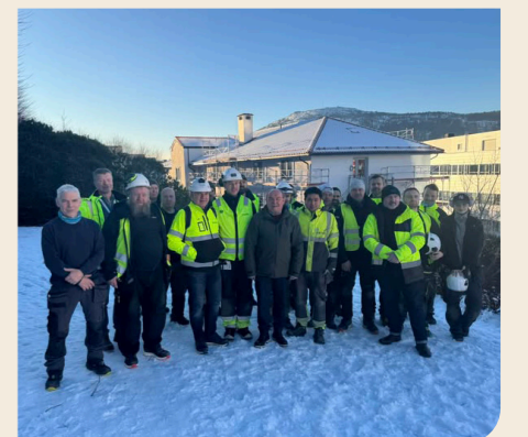
Kranselag for gjestehuset.