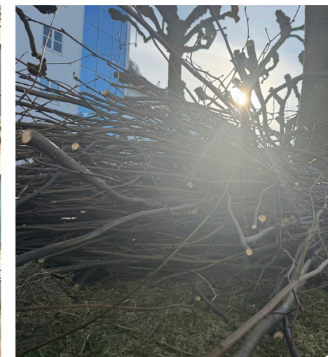
Over 20 tonn med avkapp.