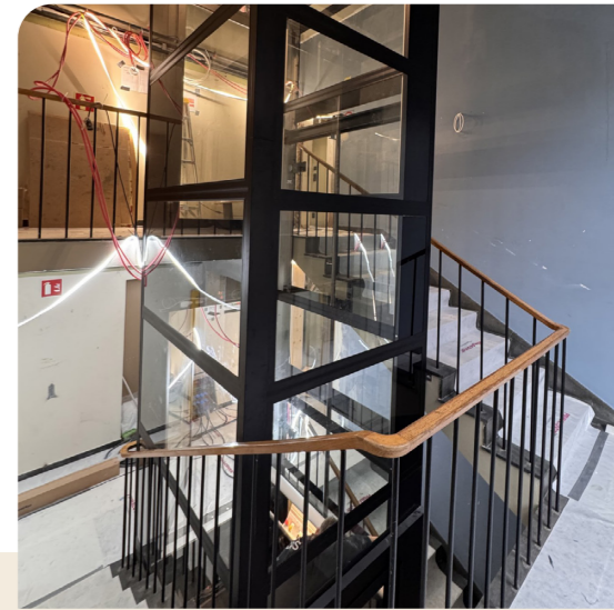
Ny heis er på plass.