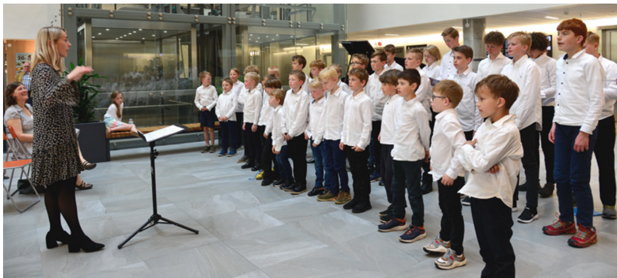
Konsert med Fridalen guttekor i sykehusets foaje.

The biggest highlight of 2019 was to receive the Improvement Award at the National Patient Safety Conference on September 27. For the first time, the award went to a hospital, with all its staff, because Haraldsplass Deaconess Hospital was the hospital that had improved most over time.