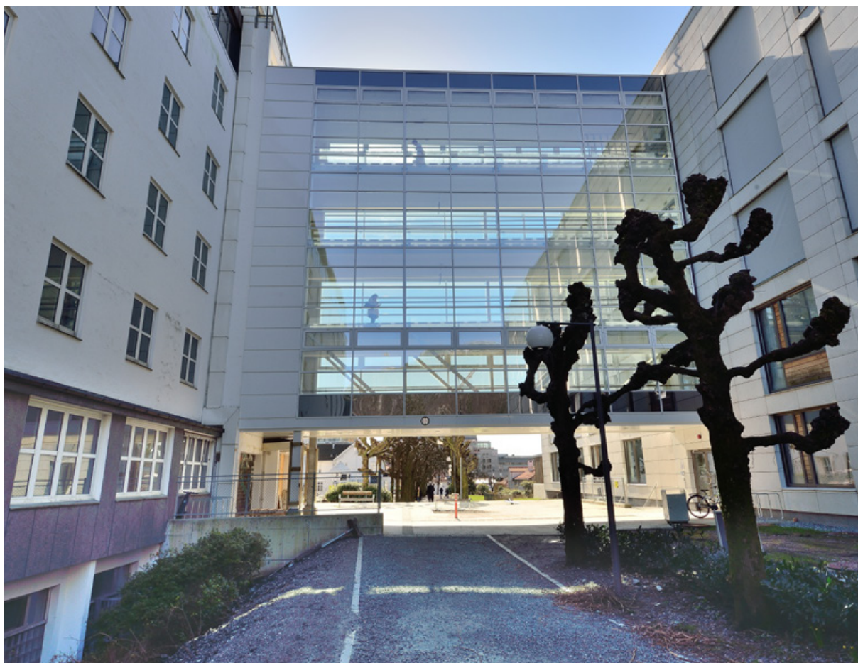
Haraldsplass Diakonale Sykehus. Glassbro mellom nytt og gammelt sykehus.